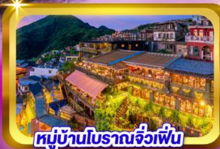
หมู่บ้านโบราณจิวเฟิ่น