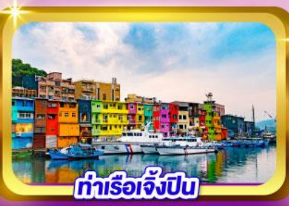
ท่าเรือเจิ้งปิน