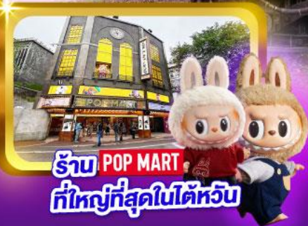
ร้าน POP MART ที่ใหญ่ที่สุดในไต้หวัน