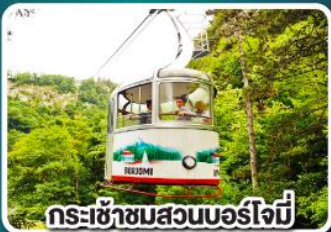
กระเช้าชมสวนบอร์โจบี