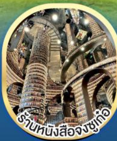
ร้านหนังสือจางชู่เก๋