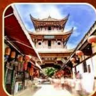
เมืองโบราณหลางจง