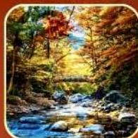
ภูเขา กวงอู๋ซาน