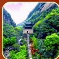
ด่านเจี้ยนเหมินกวน