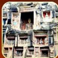
ถ้ำหินหนานคัน