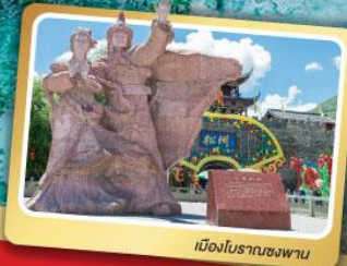
เมืองโบราณซงพาน