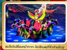
ชมโชว์เปลี่ยนหน้ากาก-โถงริเบต(ที่จิวจ้ายโกว)