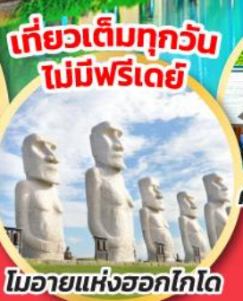
โมอายแห่งฮอกไกโด