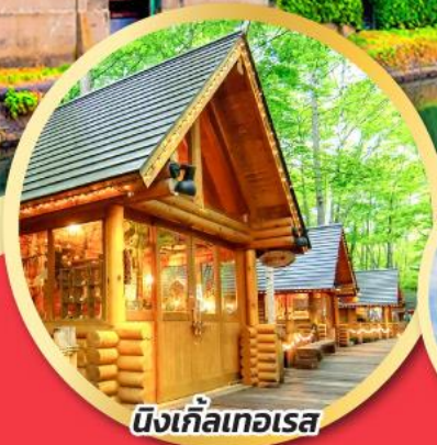
นิงเกิลเทอเรส